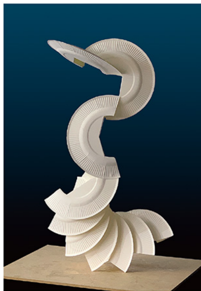
本科 デザイン・工芸